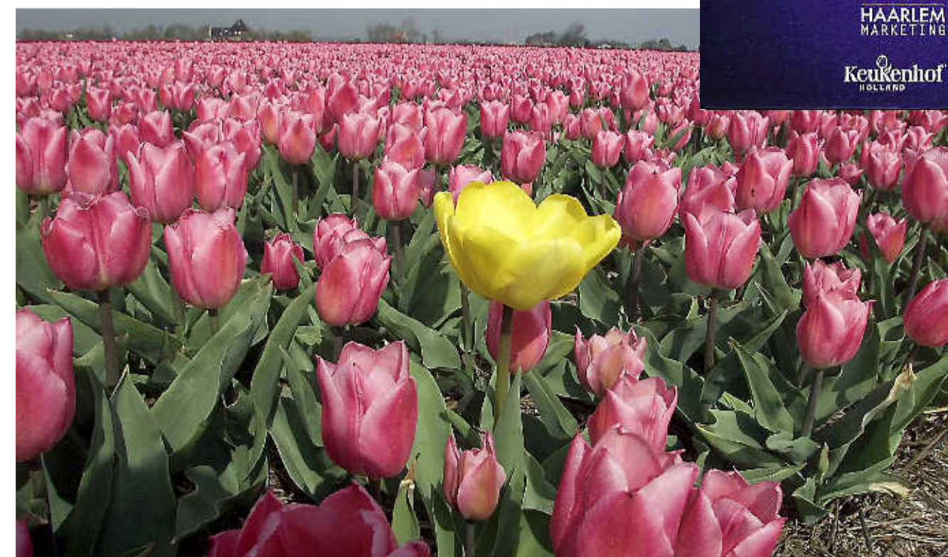
Tulpenveld in de Bollenstreek. ARCHIEFFOTO