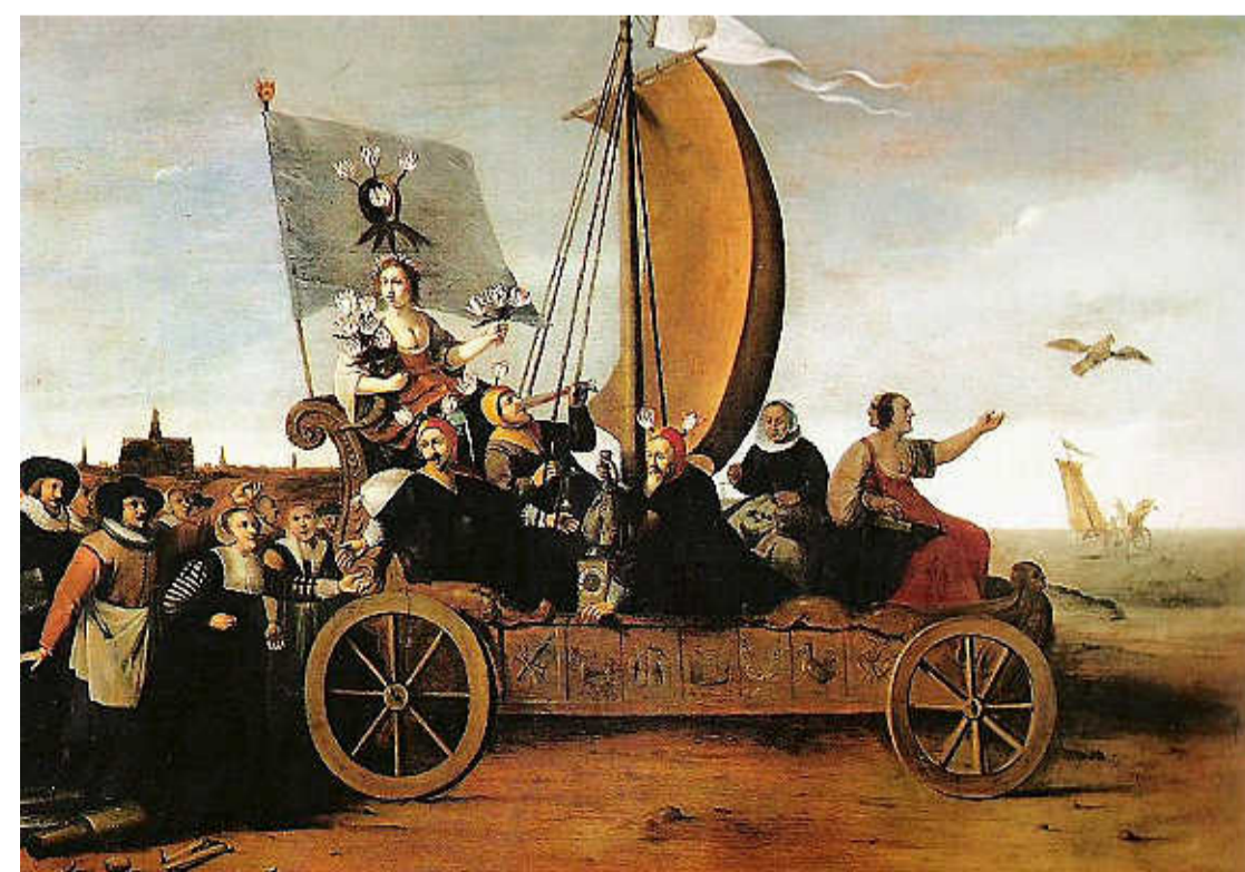
Schilderij van Hendrik Gerritsz. Pot: Haarlemse burgers achter de zegekar van de godin Flora. FRANS HALS MUSEUM