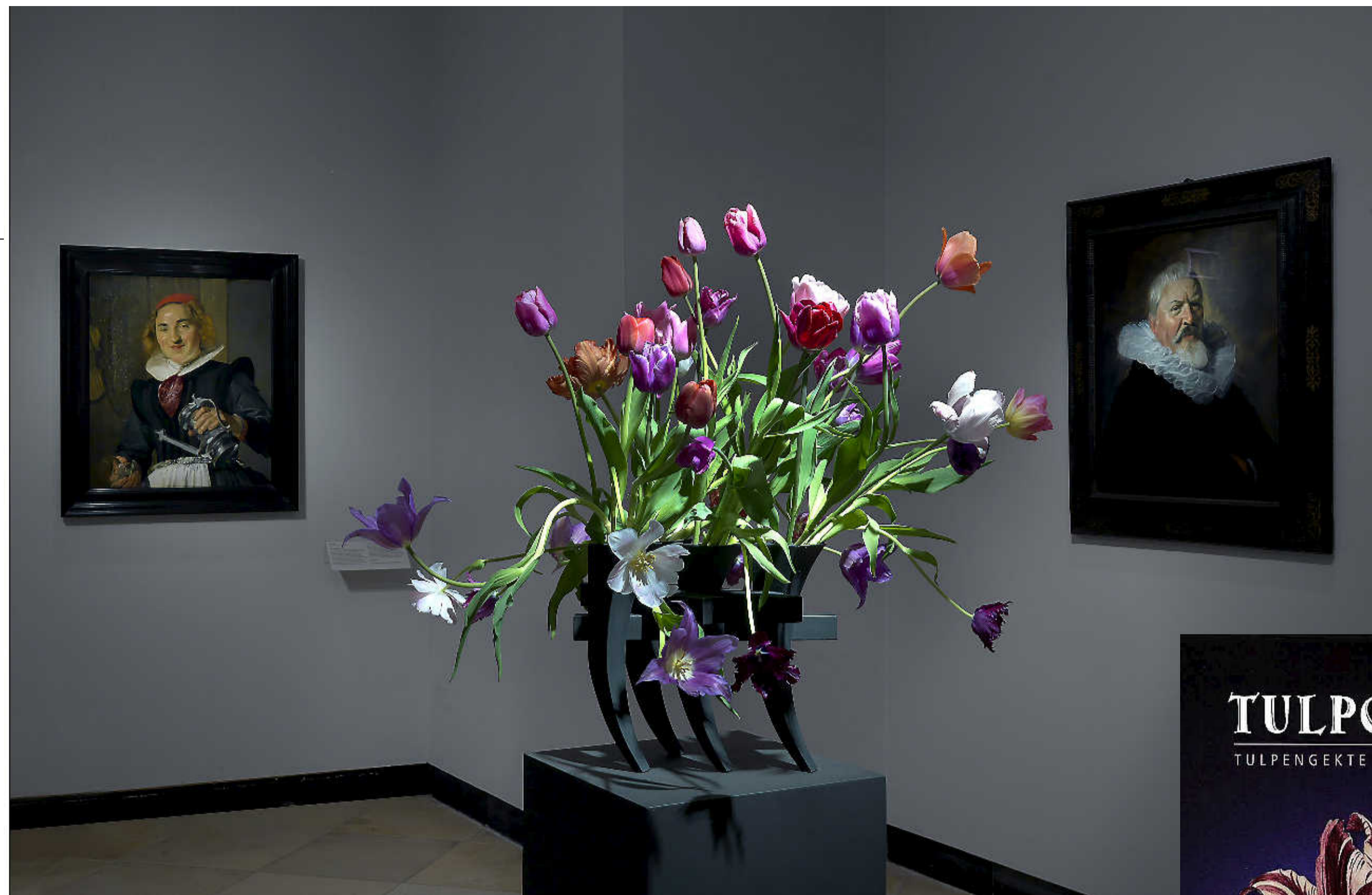
Tulpen op zaal in het Frans Hals Museum, een jaarlijkse traditie, maar ook tijdens de Tulpomania Tour.